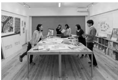
基町プロジェクト活動拠点施設「M98」 (広島市からの受託研究)

教員が企業や行政等と実施する共同研究、企業や行政等からの依頼により実施する受託研究について窓口となり、事務手続き等の支援を行います。