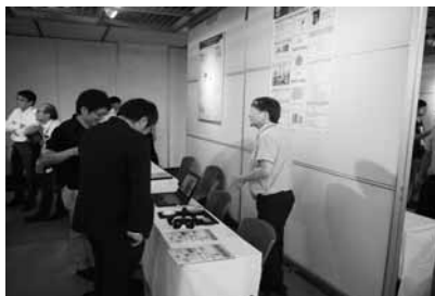
産学連携研究発表会

研究シーズ集の作成、産学連携研究発表会（産学官連携イベント）の開催等を通じて、学外に情報を発信しています。