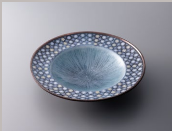
栗根 誠一郎「七宝氷紋大皿」