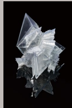
佐野 翠 「P.P.E05_MidK_x8」 可塑仮晶 呉鐵流離」